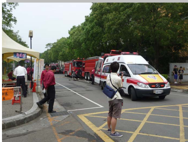
現場待命的救護車與消防車

本次演習除了我們機械系外感謝桃園縣消防局、中壢消防隊、化學兵學校等單位於活動當天的全力配合使活動達到高度仿真的練習效果。