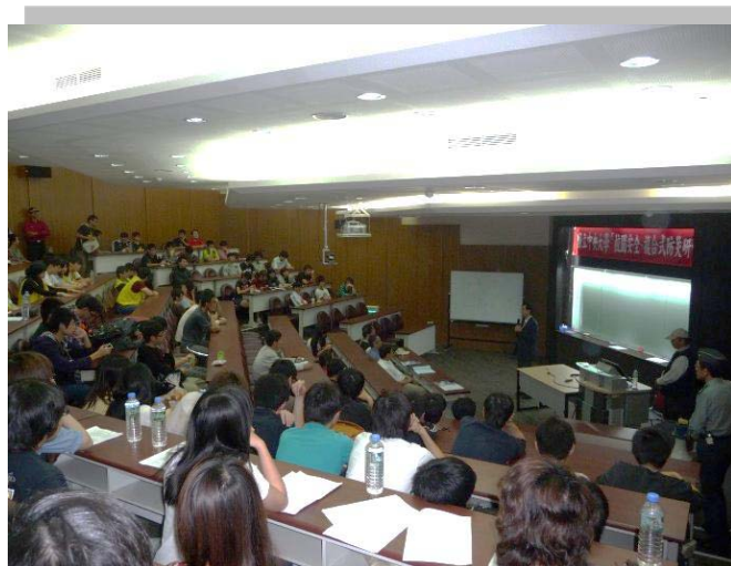
防災專題演講現場