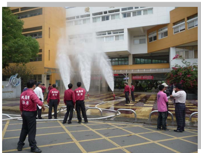
模擬實驗室高層火災演練