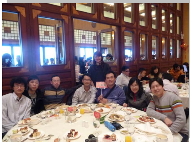
黃以玫老師與研究生