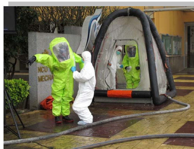
實驗室化學災害演練